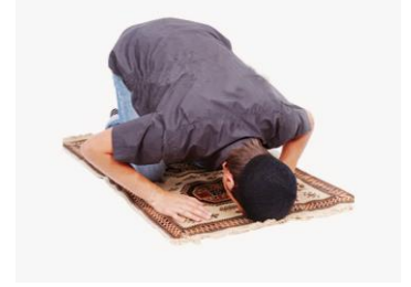
صَلَّى - يُصَلِّي - صَلَاةٌ